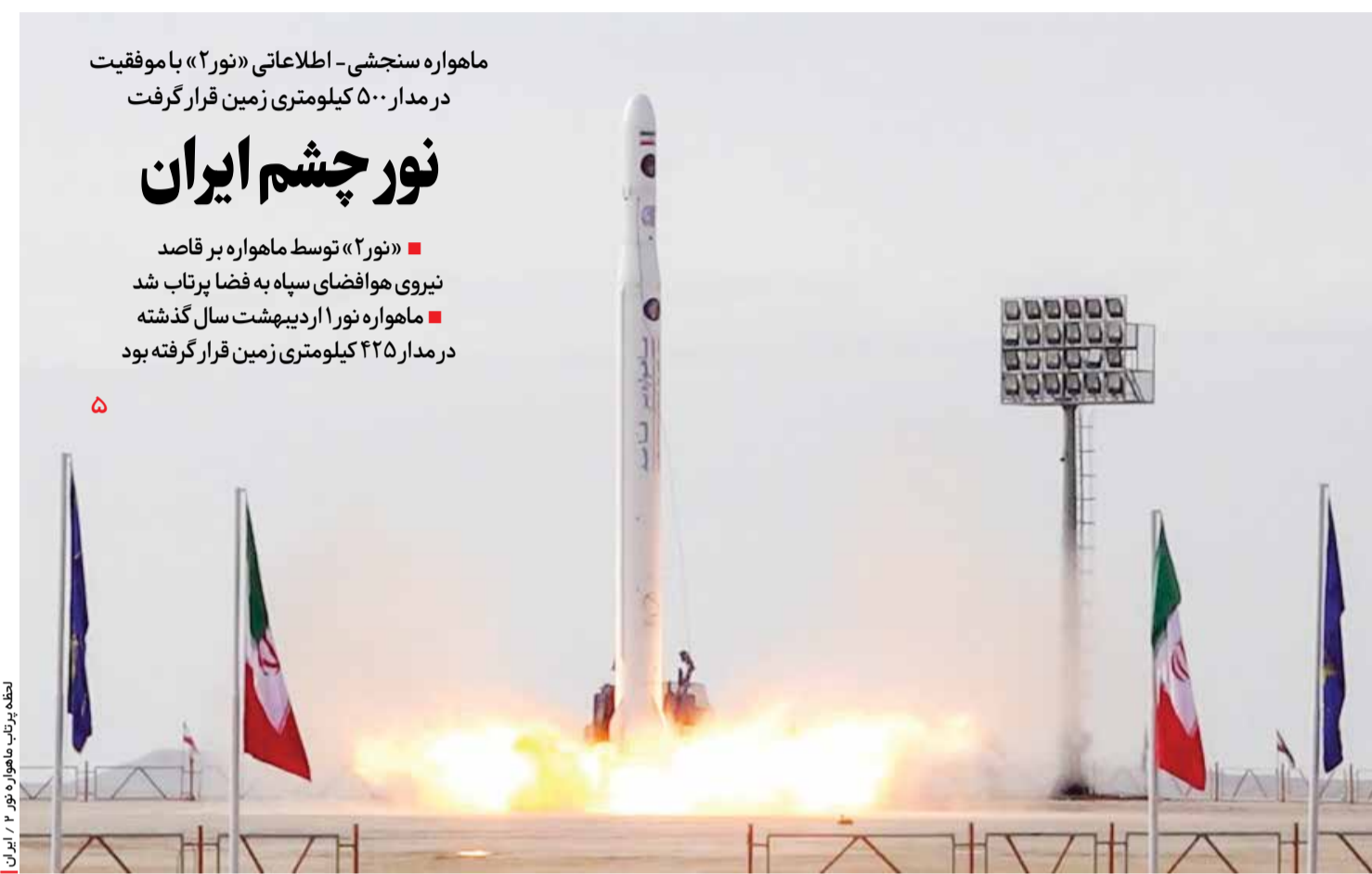
لحظه پرتاب ماهواره نور ۲ - ایران

دولت در گام اول، خنثی سازی تحریم‌ها را با جدیت پیگیری کرد و در گام دوم در مذاکراتی عزتمندانه به دنبال رفع تحریم‌هاست