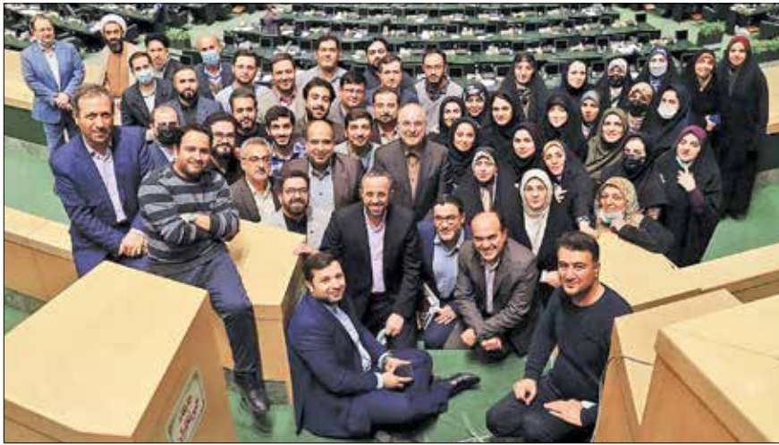
عکس یادگاری پایان سال قالیباف با خبرنگاران پارلمانی/ خانه ملت

طرح صیانت هم از همین دسته طرح‌ها است. این طرح در همان روزهای اول بررسی، از رسیدگی در صحن خارج و به کمیسیون ویژه سپرده شد. پس از بررسی‌های زیاد و پخش جلسات از رسانه ملی، کلیات طرح با وجود ممنوعیت قانونی برگزاری جلسه کمیسیون‌ها در روزهای بررسی بودجه رای‌گیری شد که واکنش‌های زیادی به دنبال داشت. با ورود معاونت قوالتین مجلس، نتیجه رای‌گیری ابطال شد تا نمایندگان دست به کار شوند و با ۱۹۰