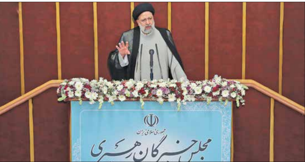
رئیس‌جمهور در دیدار با فرماندهان ارشد نیروهای مسلح

رئیس جمهور روز گذشته در اجلاسیه رسمی خبرگان رهبری با اشاره به مذاکرات وین تأکید کرد