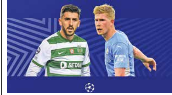
۳۰:۲۳ امشب؛ منچستریستی - لیسبون در لیگ قهرمانان اروپا

در صورتی که بازیکنان آرسنال بتوانند برای اولین بار پس از سال ۲۰۱۷ تیم شان را به لیگ قهرمانان اروپا برسانند، مسئولان این باشگاه به هر کدام از بازیکنان پاداشی به ارزش ۵۰۰ هزار پوند خواهند پرداخت. آرسنالی ها در جدول منچستریونایتد را پشت سر گذاشتند و فعلاً با سه بازی کمتر و یک امتیاز بیشتر به جایگاه چهارم جدول رسیده اند، جایگاهی که صعود آنها به بزرگ ترین لیگ باشگاهی اروپا را در فصل بعد تضمین می کند. آرسنال یک امتیاز از یونایتد جلوتر است اما سه بازی در پیش دارد. اگر آرسنال بتواند به غیبت ۵ ساله اش پایان بدهد، با جایز نقدی لیگ